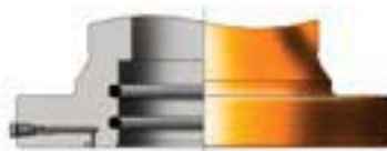
EMPAQUETADURA INTEGRAL MANUAL TIPO "00" (3)