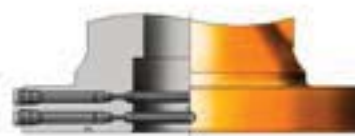
EMPAQUETADURA INTEGRAL ENERGIZABLE MODELO "P" (4)